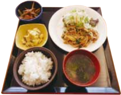
このメニューの標準カロリーは718kcal。気になるエネルギーは「ご飯の量」でコントロール。栄養バランスを保つため、おかずの数や量はそのまま

「しっかり食べよう『一汁三菜』」は、年齢や性別に合わせて、「何を、どのように、どのくらい食べるか」を提案しているレシピ本です。栄養バランスや必要な食事を、規則正しい食習慣を身につけることをコンセプトに掲げています。