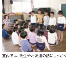
室内では、先生やお友達の話にしっかりと耳を傾けます

筑紫丘幼稚園 南区若久園地42 092-561-11060 「竹馬」が育む心と体 筑紫丘幼稚園の年長児さんが、毎年夏から初冬にかけて取り組んでいる活動の一つが「竹馬」。いまや、園庭を周回するだけでなく、小山や地形状に広がった水たまりも難なく越えられるように、「上級編」として、ステップの高さを上げたり、表面が滑りやすい「すのこ登り」や足場の悪い