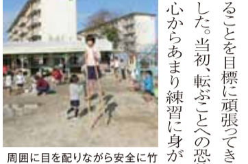
周囲に目を配りながら安全に竹馬を乗りこなします

筑紫丘幼稚園 南区若久園地42 092-561-11060 「竹馬」が育む心と体 筑紫丘幼稚園の年長児さんが、毎年夏から初冬にかけて取り組んでいる活動の一つが「竹馬」。いまや、園庭を周回するだけでなく、小山や地形状に広がった水たまりも難なく越えられるように、「上級編」として、ステップの高さを上げたり、表面が滑りやすい「すのこ登り」や足場の悪い