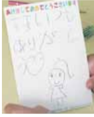
思いのこもったメッセージ

大井保育園 博多区大井2-7-12 092-621-3057 思いを込めてあけましておめでとう