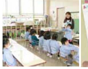
クラスのお友達にも見てもらいました