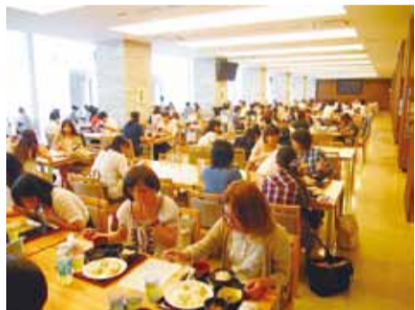
「食育館」は地域住民も利用できます。2種類の「一汁三菜」のランチ(各420円)のほか単品メニューも豊富!

この日のメインは「豚キムチ」。副菜に「ごぼうといんげんの旨煮」と「かぼちゃとさつま芋のヨーグルトサラダ」。主食は麦ごはん、汁は生姜スープ。つまり、「一汁三菜」とは、主食、汁物とおかず三品