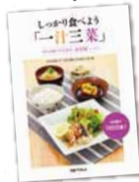
しっかり食べよう『一汁三菜』 中村学園の学生食堂(食育館)レシピ 定価1,260円、丸善プラネット