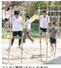
こんな「悪路」もなんのその!

ここで紹介しきれなかった情報や写真、その他の幼稚園・保育園の記事などはリトル・ママHPに掲載されています。 リトル・ママ 検索 トップページにある「子育てのひろば」をチェックしてね。