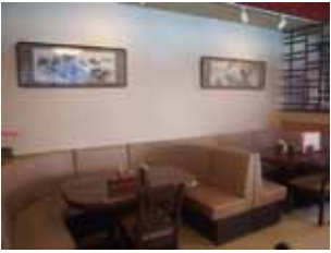
ソファでゆっくり食事が出来ます

お持ち帰りも出来ますよ！ 2階には40人収容の宴会スペースもあり、予算に合わせたプランにも相談に乗ってくれます。お気軽にお問い合わせください。