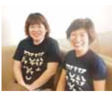
笑顔が素敵な店内スタッフ

また知る人ぞ知る通な一品「骨つき唐揚げ（1200円）」は隠れた人気メニュー。山椒を使った味付けでパリッと揚がった皮とお肉のジュシーさが決めています。