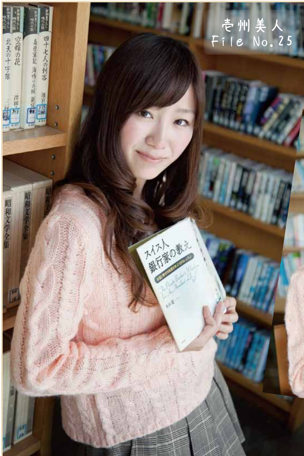
壱州美人 File No.25

ママと子どもを応援する「リトル・ママ」とのコラボが実現しました！ 2012.NOVEMBER.01 No.031